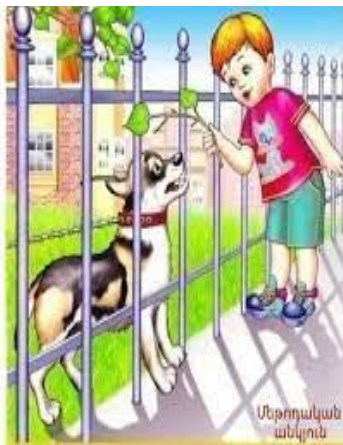
Մի՛ գայրացրու շանը