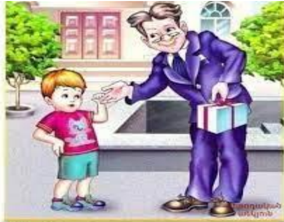
Մի՛ խոսիր անծանոթի հետ