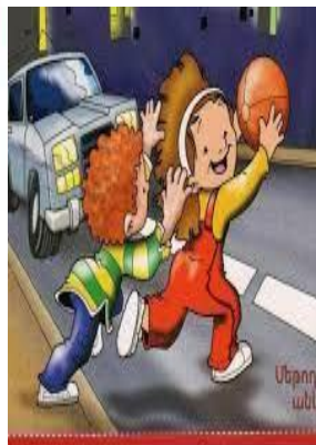
Խաղալիս Մի՛ վազիր փողոց