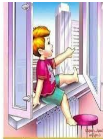
Մի՛ նստիր պատուհանագոգին